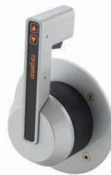
Luxe side mount