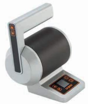
Luxe top mount